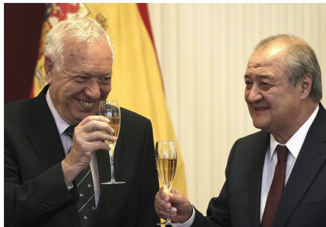
El anterior ministro de Asuntos Exteriores de Cooperación, José Manuel García-Margallo, junto a su homólogo uzbeko, Abdulaziz Kamilov, durante su visita a Uzbekistán en abril de 2014.

Ministra de Educación Infantil y preuniversitaria: Ezazkhan Karimova