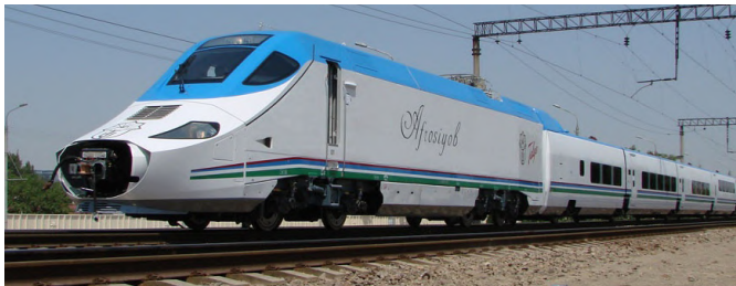
Imagen de uno de los dos trenes Talgo vendidos a Uzbekistán en el año 2009, por más de 41 millones de euros

1992-1993: Especialista jefe del Ministerio de Comunicaciones de la República de Uzbekistán.