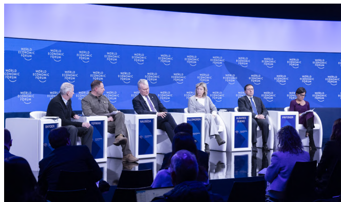
Participación en el Foro Económico Mundial de Davos del ministro de Asuntos Exteriores, Unión Europea y Cooperación, D. José Manuel Albares Bueno, (Suiza) 16.01.2024.