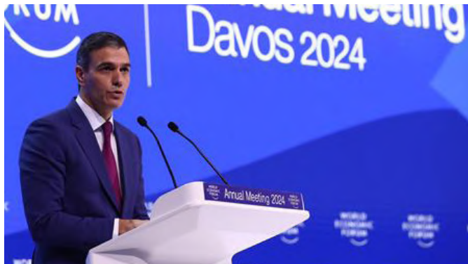
El presidente de Gobierno, D. Pedro Sánchez, durante su intervención en el Foro Económico Mundial de Davos, (Suiza) 17.01.2024.

de ese Memorándum, en octubre de 2024 se celebró la primera reunión de la Comisión Mixta, que estudió el reforzamiento de la colaboración entre centros de investigación de los dos países y de la coordinación hispano-suiza respecto a los programas de investigación europeos y las grandes infraestructuras científicas.