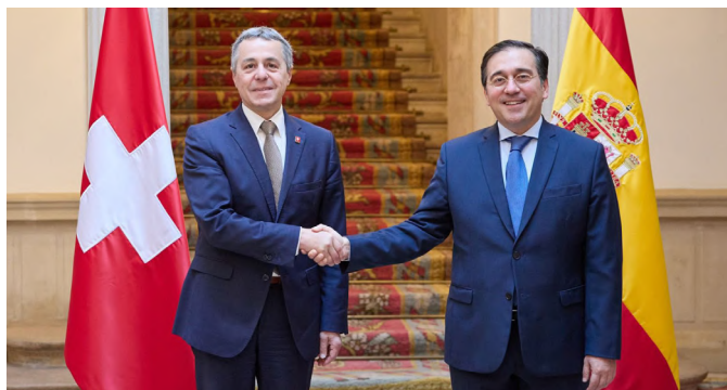
Visita a Madrid del ministro de Asuntos Exteriores, D. Ignazio Cassis, para reunirse con su homólogo español, D. José Manuel Albares Bueno, antes del inicio de la Presidencia española del Consejo de la UE 05.06.2023.