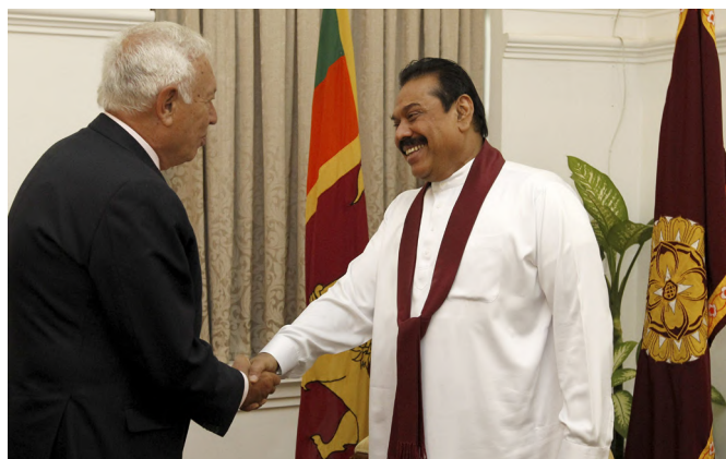
El anterior ministro de Asuntos Exteriores y de Cooperación, José Manuel García-Margallo, saluda al entonces presidente de la República de Sri Lanka, Mahinda Rajapaksa, durante su visita a Colombo, en septiembre de 2014.

Desde la elección de Anura Kumara Disanayake como presidente de Sri Lanka en septiembre de 2024, la política exterior del país ha experimentado