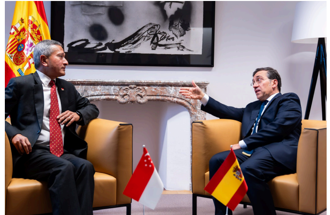
El Ministro de Asuntos Exteriores, Unión Europea y Cooperación, José Manuel Albares, junto con su homólogo de Singapur, Vivian Balakrishnan. Bruselas 20/11/2025.

Tharman Shanmugaratnam tomó posesión el 14 de septiembre de 2023 y se convirtió en el 9º Presidente de la República de Singapur. Su mandato concluye el 13 de septiembre de 2029.