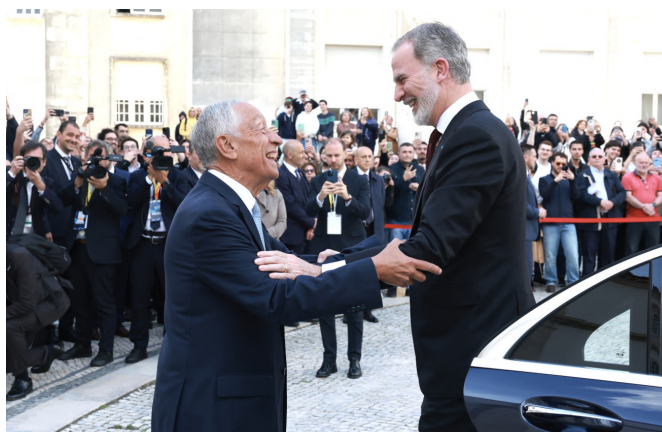
El rey Felipe VI junto al presidente de Portugal, Marcelo Rebelo de Sousa.- Coimbra (Portugal) 13/5/2025.