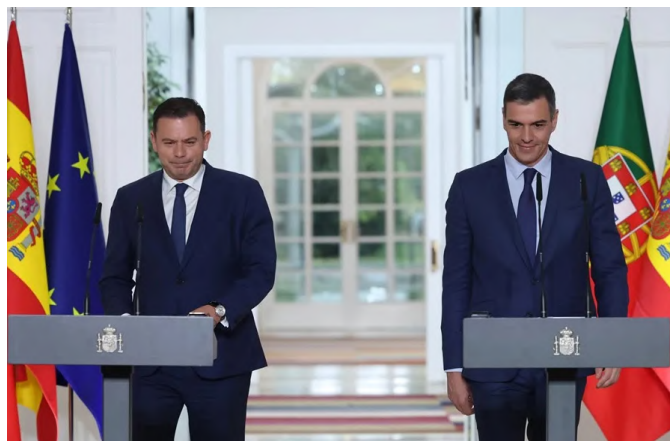
El presidente del Gobierno, Pedro Sánchez junto al primer ministro de la República de Portugal, Luís Montenegro.-Palacio de la Moncloa (Madrid) 04/05/2024.

04-06-2021 , Encuentro informal del Sr. Presidente de la República con S.M. El Rey con motivo del partido amistoso España-Portugal como parte de la presentación de la candidatura conjunta de ambos países para ser la sede del Mundial 2030.