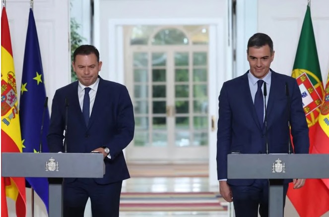
El presidente del Gobierno, Pedro Sánchez junto al primer ministro de la República de Portugal, Luís Montenegro.-Palacio de la Moncloa (Madrid) 04/05/2024.