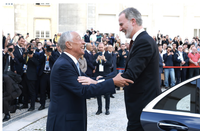
El rey Felipe VI junto al presidente de Portugal, Marcelo Rebelo de Sousa.- Coimbra (Portugal) 13/5/2025.

23-04-2023 Sr. D. Pedro Sánchez. Oporto. Gira preparatoria presidencia española Consejo de la UE.