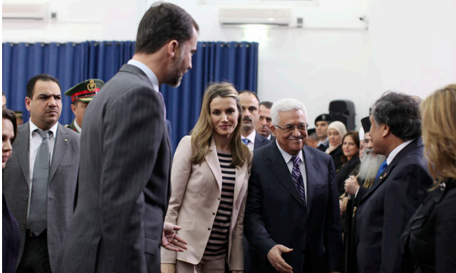
SS.AA.RR. los Príncipes de Asturias, junto al presidente de la Autoridad Nacional Palestina, Mahmoud Abbas, durante su visita a Ramala en abril de 2011.

presidente, cargo que sigue ocupando en la actualidad. Siguen pendiente de celebrarse desde 2009 las elecciones presidenciales.