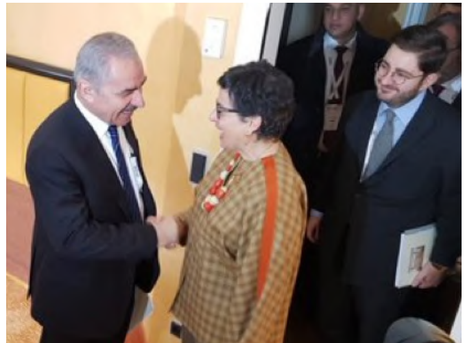
Encuentro entre la ministra Unión Europea y Cooperación, Dª Arantxa González Laya y el primer ministro palestino Mohammed Shtayyeh, durante la reunión de la Conferencia de Seguridad celebrada en Munich (Alemania)- Febrero 2020.

La inversión extranjera es muy reducida. El país con mayor inversión, tanto en IED como en IEC, es Jordania , con 1.610 millones de USD y 394 millones de USD respectivamente. La mayoría de los inversores en los Territorios Ocupados Palestinos son países árabes .