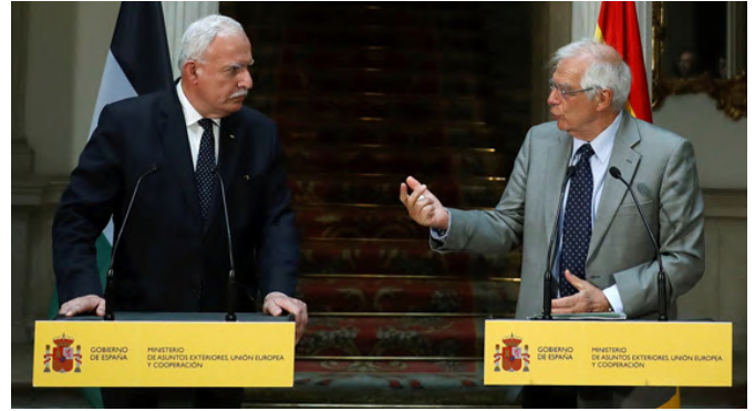
El entonces ministro de Asuntos Exteriores, Unión Europea y Cooperación Sr Borrell junto a su homólogo de Palestina, Sr Riad Malki. Madrid (Palacio de Viana), 04/09/2018

La guerra en Gaza ha revitalizado la solución de los dos Estados como única forma posible de acabar con el conflicto y lograr la paz. La Unión Europea asumió la propuesta española de convocar una Conferencia Internacional de Paz y la cuestión del reconocimiento también ha cobrado relevancia. Actualmente [12 de noviembre de 2024] 146 países reconocen a Palestina como Estado. España, Noruega e Irlanda hicieron efectivo su reconocimiento el 28 de mayo de 2024. El 10 de mayo de 2024, la AGNU votó por mayoría abrumadora (143 votos a favor) la concesión a Palestina de más derechos propios de Estado miembro, y el 18 de septiembre la AGNU votó por mayoría de 124 votos a favor una resolución sobre la implementación del dictamen del Tribunal Internacional de Justicia de 19 de julio de 2024, sobre la ilegalidad de la ocupación israelí de los territorios palestinos. Con impulso del ARVP Borrell y del Grupo de Contacto de la Liga Árabe y la Organización de Cooperación Islámica se creó el pasado 26 de septiembre la Alianza Global para la Aplicación de la Solución de los dos Estados, en la que participan más de 90 países y que celebró su primera reunión en Riad el pasado 30 de octubre de 2024.