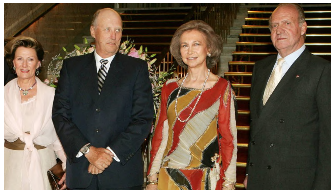
Visita a Oslo de SSMM Don Juan Carlos y Doña Sofía con motivo del 80º aniversario de los reyes de Noruega Harald y Sonia. Oslo, 10 de mayo de 2017

La Embajada de España colabora con instituciones culturales del país para apoyar y promocionar la participación de artistas españoles en eventos en