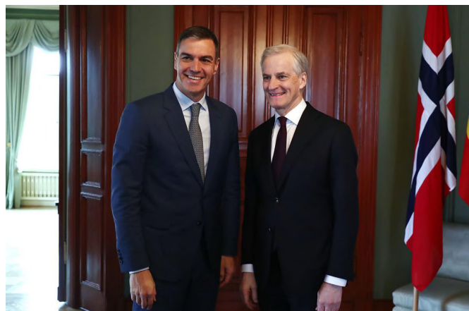
El presidente del Gobierno, Pedro Sánchez, junto al primer ministro del Reino de Noruega, Jonas Gahr Støre. Oslo (Noruega) 12.4.2024.

El príncipe Harald terminó sus estudios secundarios en 1955, iniciando su formación militar en la Escuela de Caballería hasta 1959.