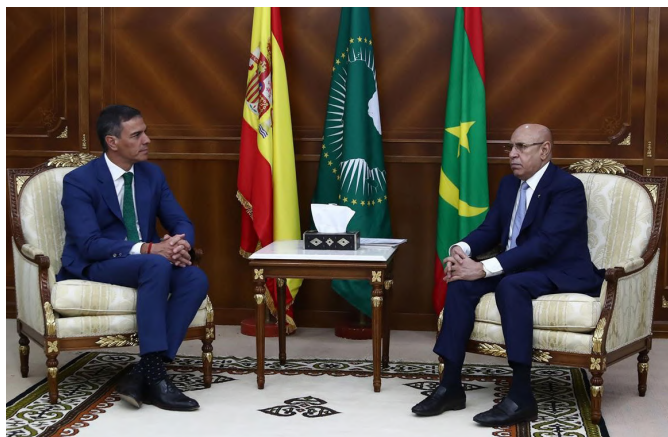
El presidente del Gobierno, Pedro Sánchez, y el presidente de la República Islámica de Mauritania, Mohammed Cheik El Ghazouani durante la reunión que han mantenido en Nuakchot, el 27 de agosto 2024.

tería migratoria, de seguridad y de cooperación al desarrollo. En los últimos años, las relaciones bilaterales con Mauritania conocen un desarrollo sin precedentes, habiéndose producido un incremento del ritmo de intercambio de visitas y viajes de alto nivel (apartado 3.6.). Mauritania ratificó en 2024 el Tratado de Buena Vecindad, Amistad y Cooperación de 2008 con España.