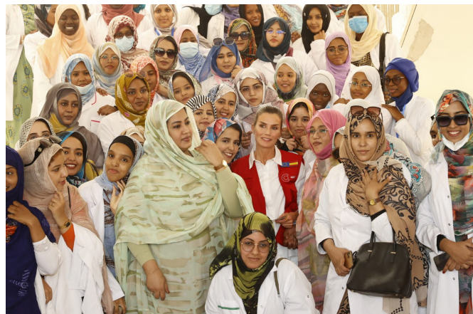
SM la Reina junto a Su Excelencia la Primera Dama de la República Islámica de Mauritania acompañadas de estudiantes de la Facultad de Medicina de la Universidad de Nuakchot (República Islámica de Mauritania), 01/06/2022.

Mauritania es hoy el país más estable en la región sahelo-sahariana. Su presidente, Mohamed Ould Cheikh Ghazouani, del partido INSAF (antiguo