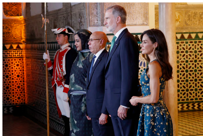
Sus Majestades los Reyes de España junto al presidente de la República Islámica de Mauritania, Mohamed Ould Cheik El Ghazouani y primera dama de Mauritania, en Sevilla, 29 de junio 2025.-Foto: © Pool Casa Real

Gobernador del Banco Central , Sr. Mohamed Lemine Dhehby.