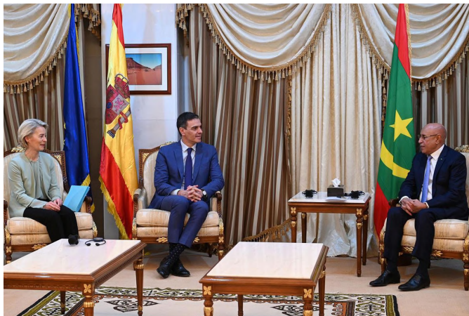
La presidenta de la Comisión Europea, Ursula von der Leyen y el presidente del Gobierno, Pedro Sánchez, junto al presidente de la República Islámica de Mauritania, Mohamed Ould Ghazouani, durante una visita conjunta a la República Islámica de Mauritania. Nuakchot (Mauritania) - 8.2.2024.

En 2015, Mauritania introdujo el español como lengua extranjera en cuatro "Institutos de Excelencia" bilingües (inglés-español) en Nuakchot y Nuadibú. En la actualidad, hay tres Lectorados de español en la Universidad de Nuakchot financiados por la AECID con una contribución de la Universidad.