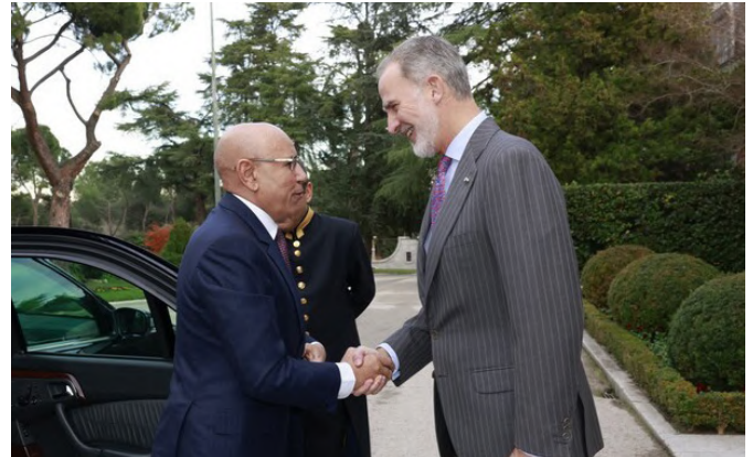
Su Majestad el Rey Don Felipe junto al presidente de la República Islámica de Mauritania, Mohamed Ould Cheik El Ghazouani, en Madrid, 5 de diciembre 2024.- Foto: © Pool Casa Real.