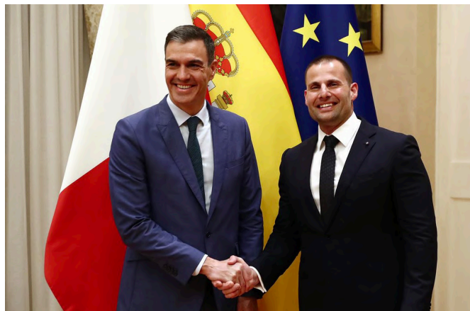
Reunión entre el presidente del Gobierno Pedro Sánchez y el primer ministro maltés Robert Abela.- La Valeta (Malta) 04/04/2023.