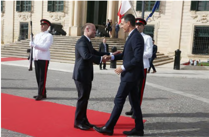
El presidente del Gobierno, entonces en funciones, Pedro Sánchez, saluda al anterior primer ministro de Malta, Joseph Muscat, a su llegada a La Valeta (Malta) para participar en la sexta Cumbre de países del sur de Europa, que reúne a los jefes de Estado o de Gobierno de Chipre, España, Francia, Grecia, Italia, Malta y Portugal. Junio 2019.

La forma de estado y de gobierno es el de una República parlamentaria unicameral, con un sistema representativo y de administración inspirado en el británico.