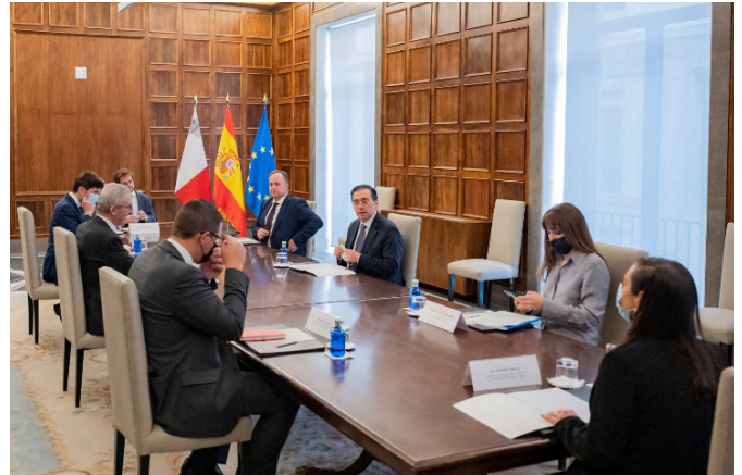
Reunión entre el ministro español D. José Manuel Albares y su anterior homólogo maltés Evarist Bartolo.-Madrid, febrero de 2022.

Entre las principales medidas económicas destacan la apuesta por el sector digital, con el objetivo de llevar a Malta al top 3 del índice de la economía y de la sociedad digital de la UE (Índice DESI, actualmente ocupa en sexto lugar), la reducción de la burocracia para facilitar la identificación de las empresas que operan en el país, un nuevo portal de registro de empresas, la eliminación del requisito de auditoría para las pequeñas empresas o subvenciones a las start-ups.