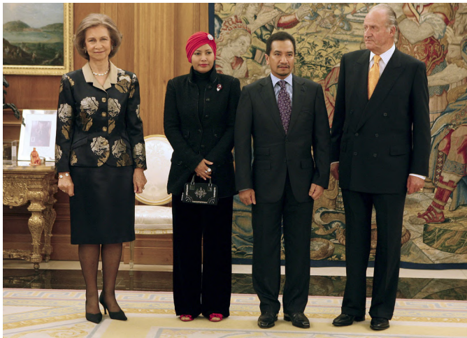
SS MM los reyes de España, junto a SS MM los reyes de Malasia, durante la visita oficial que realizaron a España, en octubre de 2008.

Tras reducirse el déficit público del 5% al 4% en 2024, el presupuesto de 2025 contempla un déficit del 3,8%. La deuda pública de Malasia en 2024 ha sido del 64% del PIB.