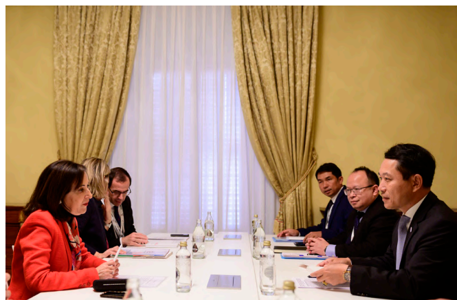
La Ministra de Defensa, Margarita Robles, junto a su homólogo, el Ministro de Defensa de Laos, General Chansamone Chanyalath. Vientián, 16 de diciembre de 2019.

Las relaciones entre Laos y España se enmarcan en el contexto de las relaciones de Laos con la UE, uno de los principales donantes de Laos y uno de sus principales socios comerciales.