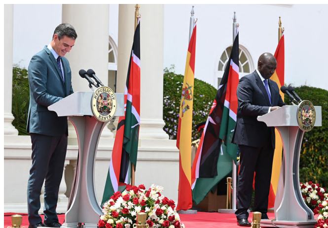
Declaración institucional del presidente del Gobierno, Pedro Sánchez, y del presidente de Kenia, William Ruto. Nairobi, 26 de octubre de 2022.

Los flujos de inversión extranjera directa (IED) entrantes en Kenia se mantuvieron estables en torno a los 1.500 MUSD en 2024. Adicionalmente, el stock acumulado de IED entrante alcanzó los 12.699 MUSD en 2024, lo que representa un sólido crecimiento del 10,3% en un año.