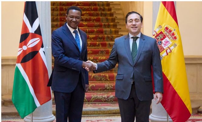
El ministro de Asuntos Exteriores, Unión Europea y Cooperación José Manuel Albares, junto al entonces ministro de Asuntos Exteriores y de la Diáspora de Kenia, Alfred Mutua. Los dos Ministros firmaron un memorando sobre aprendizaje de idiomas entre el Ministerio de Educación de Kenia y el Ministerio de Educación y Formación Profesional de España. Madrid, 27 de abril de 2023.