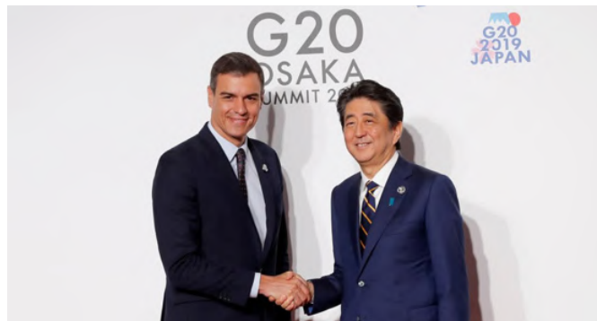
Encuentro del presidente Pedro Sánchez con el anterior primer ministro japonés Shinzo Abe, durante la celebración en Osaka el día 28 de junio 2019 en los márgenes de la Cumbre del G-20.

Al tratarse España y Japón de dos países desarrollados, no existe entre ellos cooperación para el desarrollo. Sin embargo, la Agencia Española de Cooperación Internacional para el Desarrollo (AECID) y la Japan International Cooperation Agency (JICA) participan en mesas o grupos de coordinación de donantes en varios países en desarrollo, así como en fondos de inversión y bancos regionales de desarrollo.