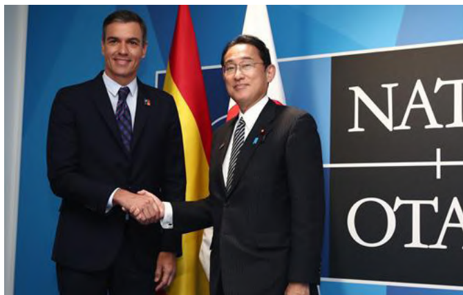
El primer ministro japonés Kishida junto al presidente español Sánchez.- Madrid 29-30 de junio de 2022.-Foto: Pool Moncloa/Fernando Calvo

En 2018 se conmemoró el 150 aniversario del establecimiento de relaciones diplomáticas entre España y Japón con una amplia agenda de actos culturales, económicos, sociales y políticos, que culminaron con la visita del primer ministro Abe a España en octubre de ese año. Durante su estancia en Madrid, el primer ministro Abe y el presidente Sánchez suscribieron una Declaración que elevó nuestras relaciones a la categoría de estratégicas. Esta Declaración supone un nuevo impulso para desarrollar nuestros vínculos sin límites temporales ni temáticos.