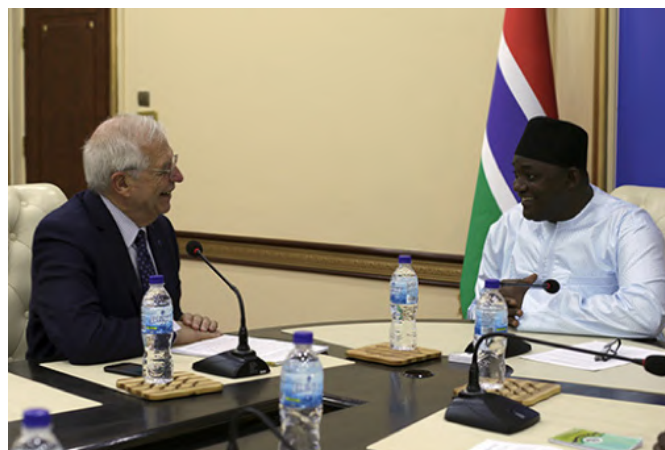
El entonces ministro Borrell fue recibido en Banjul por el presidente de Gambia, Adama Barrow.

Junio-julio de 2025: Del 31 de junio al 3 de julio tuvo lugar la 4ª Conferencia de Naciones Unidas sobre Financiación para el Desarrollo en