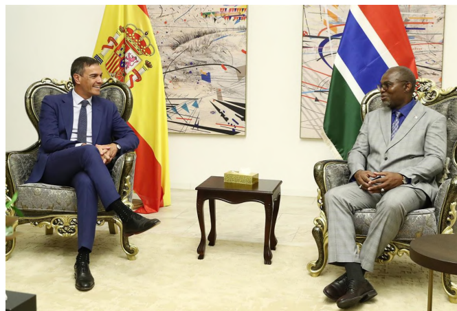
Encuentro entre el Vicepresidente de Gambia, Muhammad B.S Jallow y el presidente del Gobierno Pedro Sánchez, con motivo de su viaje a Gambia. Agosto 2024.