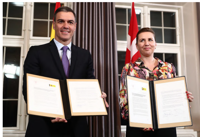
El presidente de Gobierno, Pedro Sánchez, y la primera ministra del Reino de Dinamarca, Mette Frederiksen, tras la firma de un memorando de entendimiento sobre energías renovables.-Dinamarca 2/3/2023.