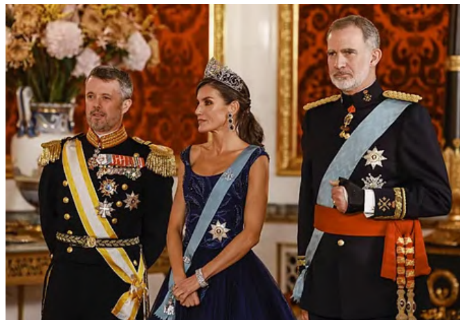
Los reyes de España posan junto al príncipe Federico, a su llegada a la cena de gala ofrecida en el Palacio de Christiansborg, en Copenhague, 07/11/2023.

https://results.elections.europa.eu/es/escanos-partidos-politicos-nacionales-grupo-politico/2024-2029/