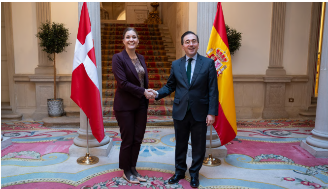
El Ministro de Asuntos Exteriores español, José Manuel Albares, junto con la Ministra de Asuntos Europeos de Dinamarca, Marie Bjerre, Madrid, 6 de febrero de 2025.