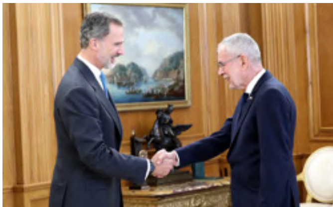
SM El Rey junto al presidente Federal de la República de Austria, Sr. Alexander Van Der Bellen, Palacio de La Zarzuela. Madrid, 03.12.2019.