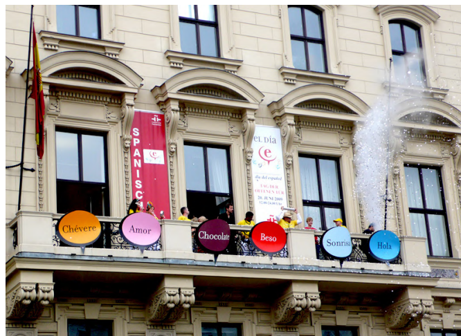
Fachada del Instituto Cervantes de Viena.