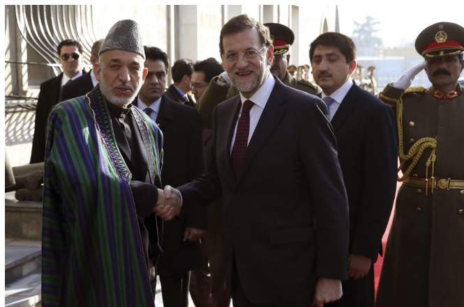
El anterior presidente del Gobierno, Mariano Rajoy, saluda al entonces presidente afgano, Hamid Karzai, durante su visita a Kabul en diciembre de 2012 para reunirse con las tropas españolas.